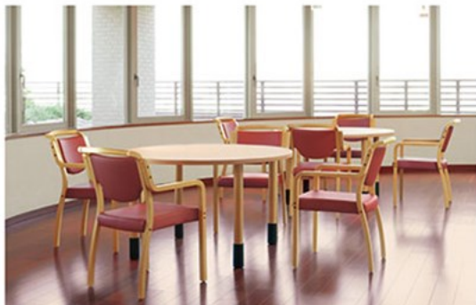
▲天板参考品-1200φ-MG-NA 649H~749H チェア:ロウ5NL (P135)