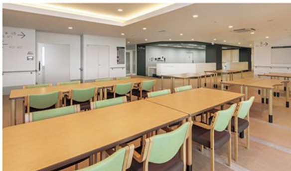
▲TB92Y8-MG-NA ¥108,900 1600W900D650H~750H ○反り止めパーツ付 TB92Y2-MG-NA ¥103,200 1600W600D650H~750H ○反り止めパーツ付 チェア:リスカA (P136)