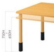
※H寸法は天板厚30xの場合