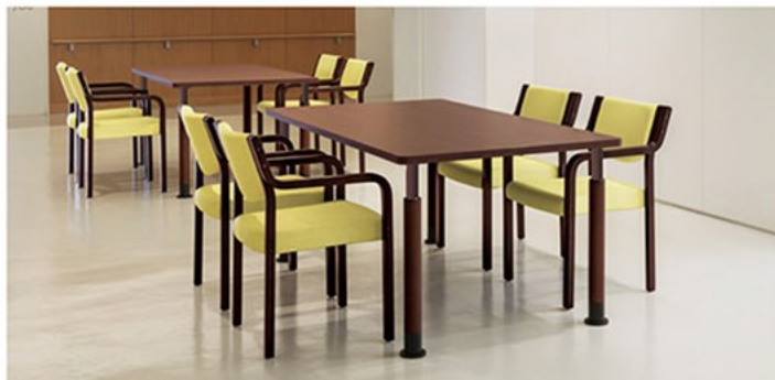
▲TB2948-MA-DB ¥149,900 1600W900D600H~800H ○反り止めパーツ付 チェア:リスカB 1N (P136)