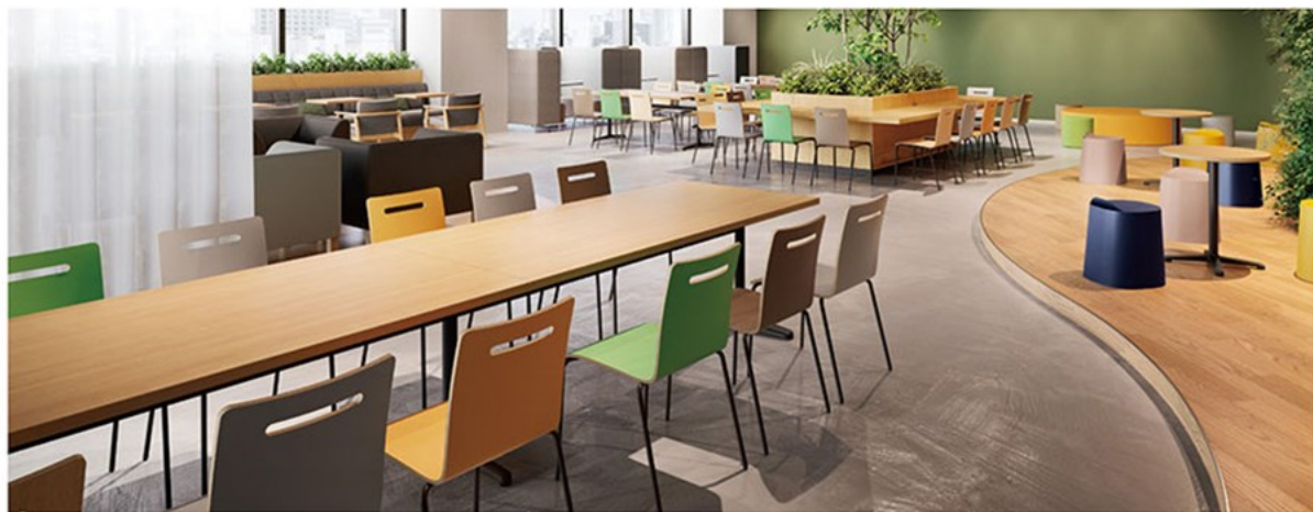
▲TB3133-IF-BL (連結タイプ) チェア:キーン1-BL (P178) 右のテーブル:TB3135-GF-BL ¥48,900 600φ 700H 右のチェア:ブラカ (P199)

食品施設、病院・老健施設、学校（幼・保育園）などの衛生空間にも、特に安心してお選びいただけるシリーズです。