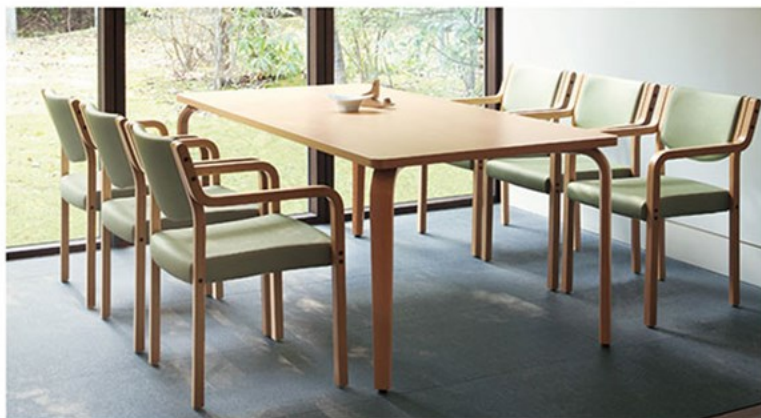
▲T20 M2-1800W900D - ML 5N ¥107,100 700H ○反り止め金具付 チェア:リスカB 5N (P136)