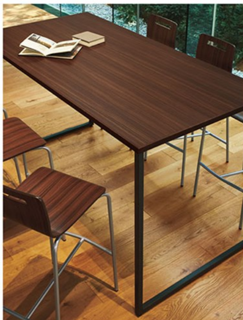
▲TB2922-LEH-DG ¥150,700 1800W750D 998H ○反り止めパーツ付 チェア:キーンカウンター 1SI-MX(P232)