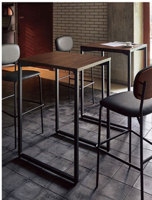
▲TB3079-LEH-DG ¥65,500 600W750D 1000H チェア:ルベカウンター DG-MX(P231)

1800W750D 998H 脚部:¥44,000 天板:¥89,500 > P341 表面材:メラミン化粧板 縁材:ブナ無垢材 ○反り止めパーツ付