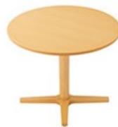
T09 5N-900φ-GAW-5N ¥117,600 695H/脚750L 天板:¥71,400 脚部:¥46,200 > P383