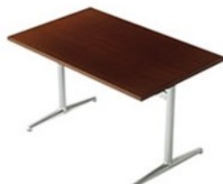
T09 1N-1200W750D-IF-PO ¥85,300 695H/脚650L 天板:¥53,600 脚部:¥31,700 > P378