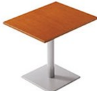
T09 9N-600W750D-EV-SI ¥52,600 695H/脚450P 天板:¥28,500 脚部:¥24,100 > P372