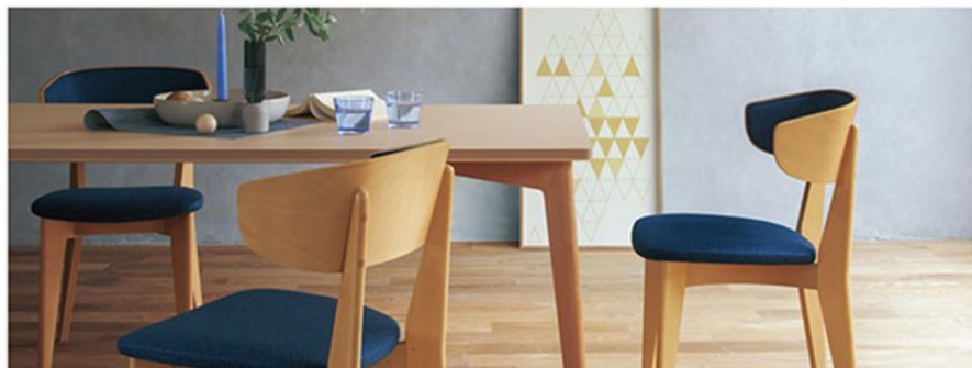
▲T14 MN-1800W 900D-LG-SN ¥180,500 696H ○反り止めパーツ付 チェア:モルヘンB 5N (P20)