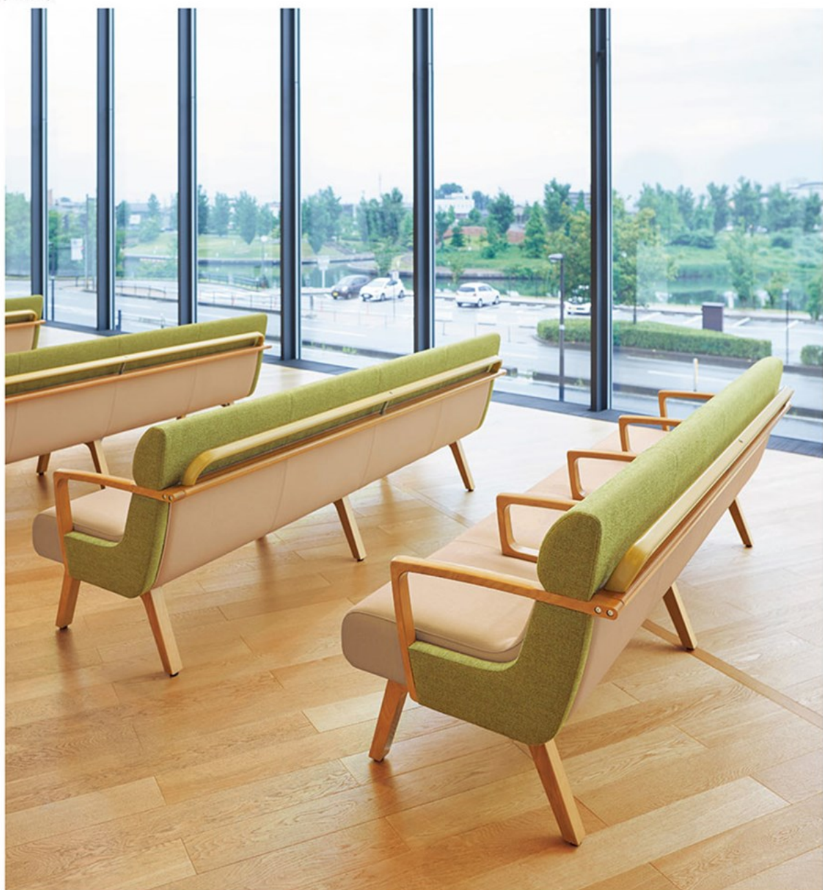
▲コルナスLVH5N-A(手すり付) ¥455,300 素材:布地-C41(ライトグリーン)×レザー-C12(No.3)