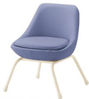
ユッタ WH ¥37,100 素材: レザー・A-80 (No.87)