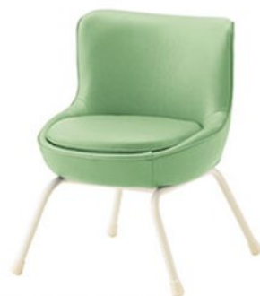
マージー WH ¥39,900 素材: レザー・A-80 (No.84)