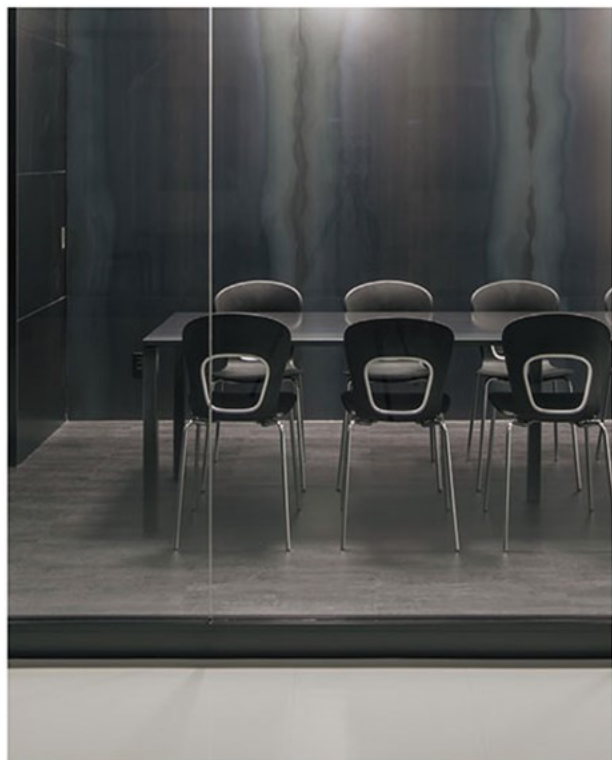
▲ラスバ CR-B ¥42,400