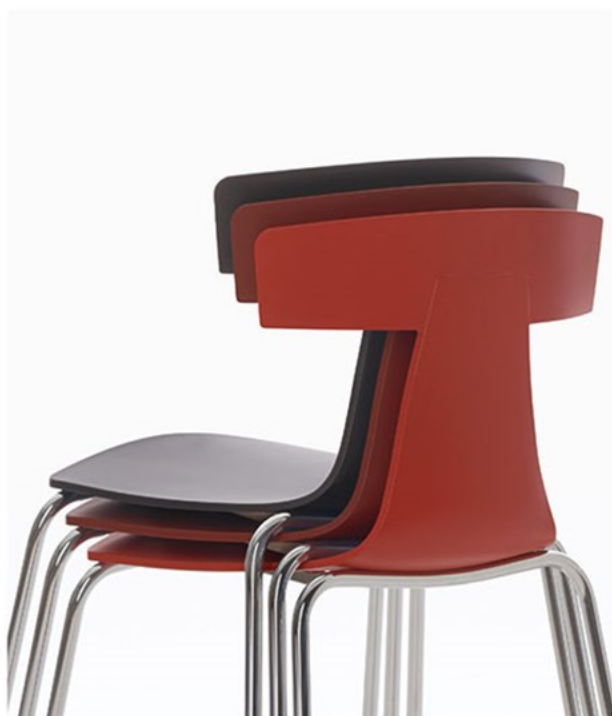
▲ラメ CR-B、K、L ¥55,900