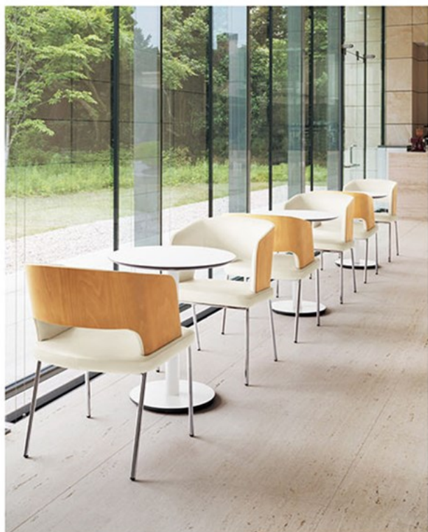
▲バレットS ¥98,500 素材:レザー-C22(No.1) テーブル:TB2715-QV-MV (P329)