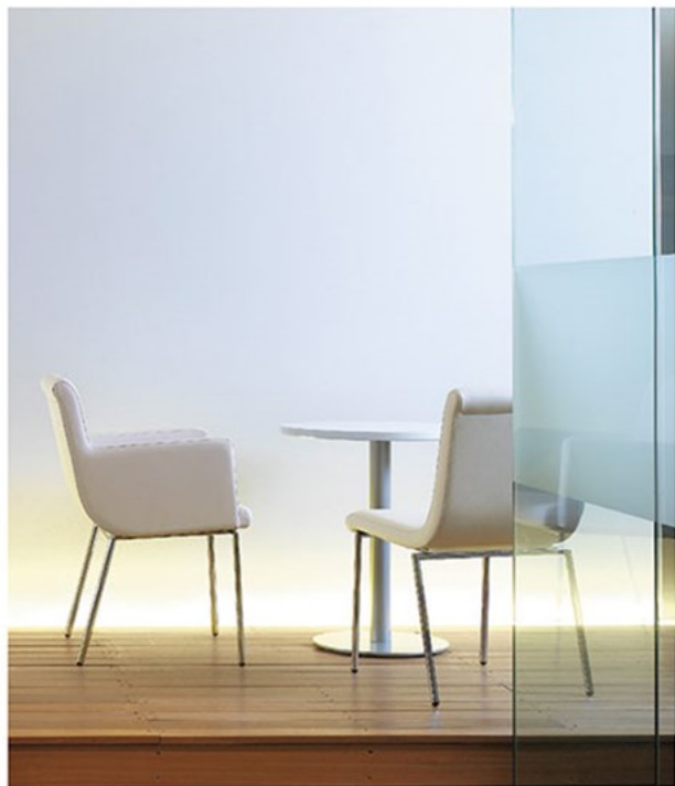
▲エクトルM ¥44,900 エクトルW ¥72,100 素材:レザー-C22(No.1) テーブル:T14 MW-600φ-S5-SI (P318)