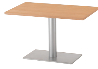
TB3138 - EV1-SI ¥90,600 1200W 750D / 脚750L 天板:¥56,900 脚部:¥33,700 ▶P.352