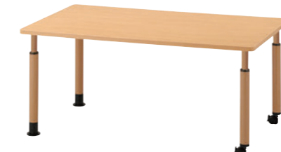
TB2938 - MA-C-NA ¥154,300