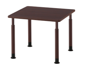
TB2960 - MA-DB ¥114,300