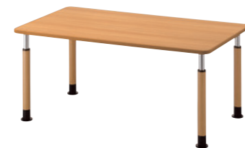
TB2979 - MA-NA ¥155,300 1600W 900D 天板:¥72,300 脚部:¥77,400 ▶P.335 反り止めパーツ付(1本使用):¥5,600