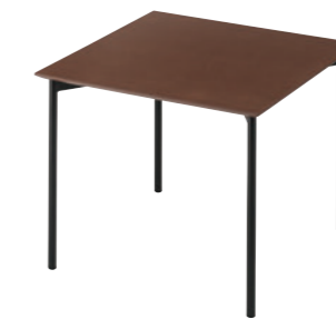
TB3300 - LV-900D ¥156,900 900W 900D 715H 天板:¥93,700 脚部:¥63,200 ▶P.357