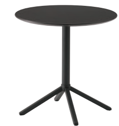
TB3316 - GR-DG ¥132,000 750φ 715H 天板:¥87,300 脚部:¥44,700 ▶P.356