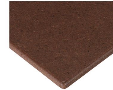
ナチュラル (クリア塗装)