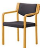
SNL レザー-C-12 (No.19)