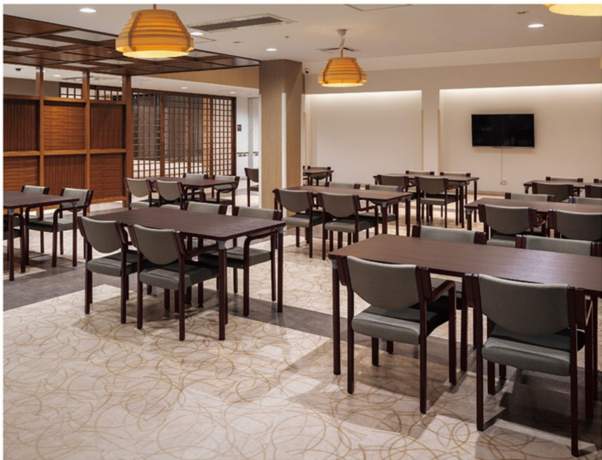
▲リスカB 1N ¥51,700 張材:レザー-C-12 (No.18) テーブル:T1B 1N-1500W8000 (エッジ特注仕様) -MD-DB (P315)