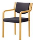
SNL レザー-C-12 (No.19)