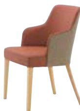
アルクス 5N ¥71,600 張材: 布地・ファベル・イース (T-4484) × レザー・C-22 (No.43)