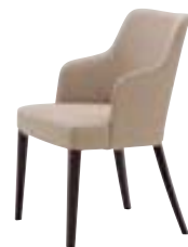
アルクス 1N ¥71,000 張材: 布地・D-06 (ペーリュ)