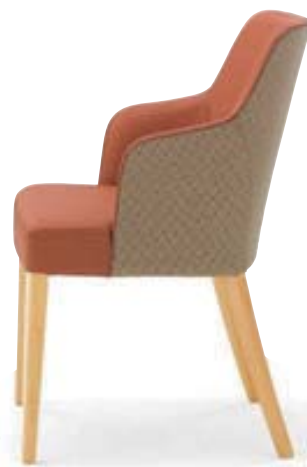
アルクス 5N ¥71,600 張材: 布地・ファベル・イース (T-4484) × レザー・C-22 (No.43)