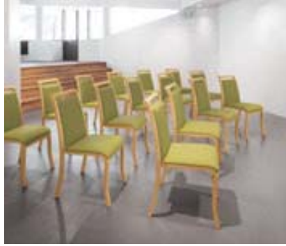
テネル HN ¥36,900 張材:レザー-C-38 (No.6)