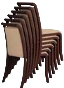
テネル 11N ¥36,900 張材:布地-C-53 (アイボリー)