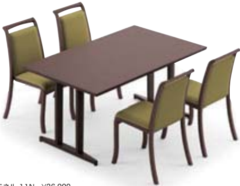
テネル 11N ¥36,900 張材:レザー-C-68 (No.3) テーブル:T22 1N-1500W 900D - IY-1N (P396)