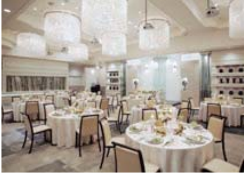
テネル 11N 張材:布地