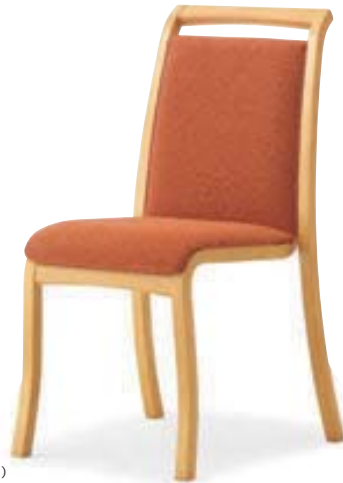
テネル HN ¥37,500 張材:布地-D-19 (オレンジ)