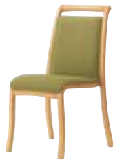
テネル HN ¥35,300 張材:レザー-B-15 (No.26)