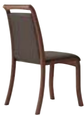
テネル 11N ¥36,900 張材:レザー-C-22 (No.46)