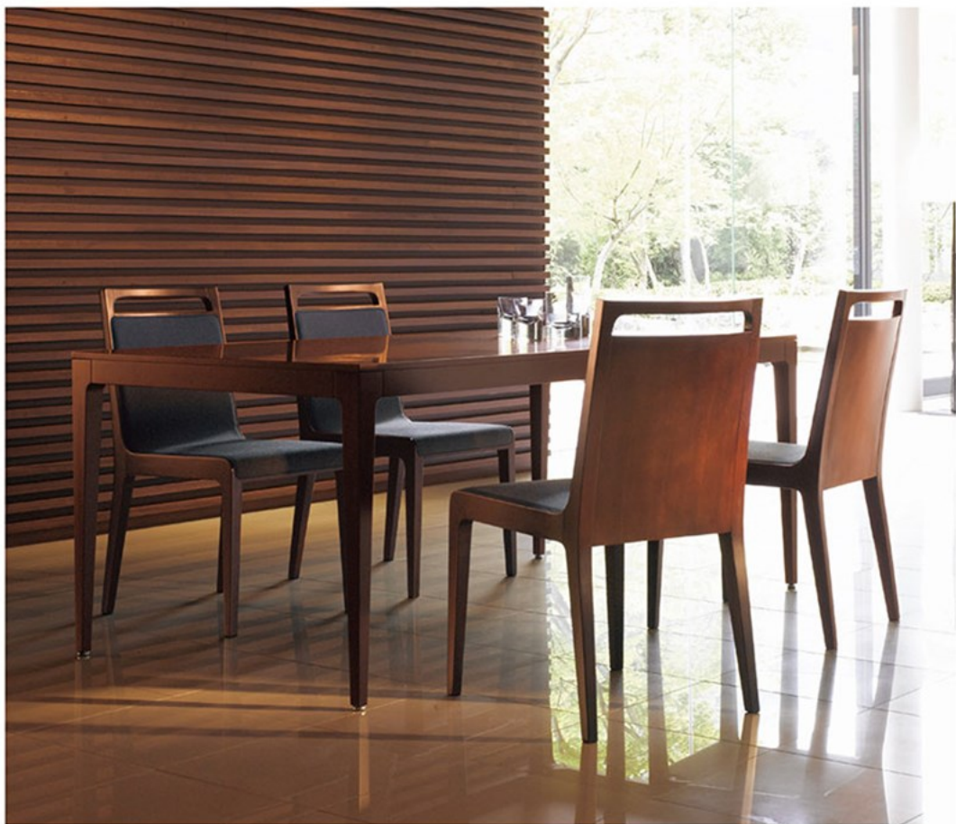
▲ミールス 1N ¥49,500 素材:布地・C-53 (ダークグレー) テーブル:参考品