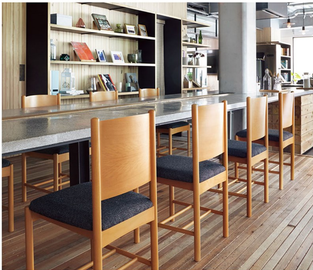
▲エトーレSN ¥44,000 素材:布地・C-42(ダークグレー)