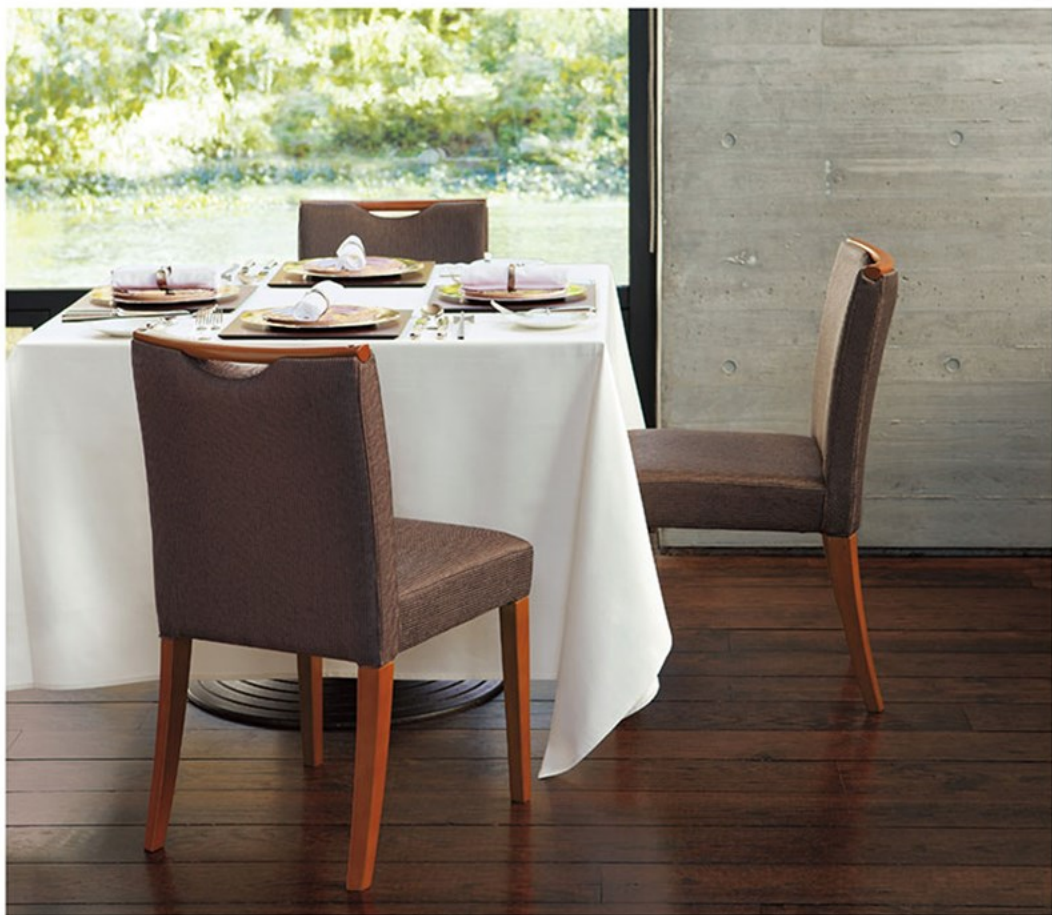
▲ディック 9N ¥74,400 素材:布地・ライツ(T-7460)