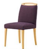
SN-BC 布地・D-54(バイオレット)