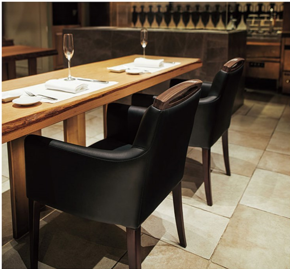
▲アモードFW 1N-WN ¥83,700 素材:レザー・C22 (No.6)