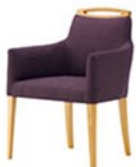
SN-OA 布地・D-54(バイオレット)