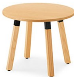
TB3047-MM-BL/NA-AS ¥157,100 900φ701H 脚部:¥54,200 天板:¥102,900 > P325 表面材:アッシュ突板(板目) 継材:アッシュ無垢材