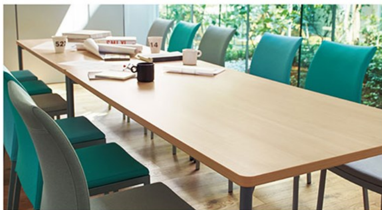
▲T20 M2-1800W900D-LD-SI ¥100,400 720H ○反り止めパーツ付 チェア:リエカH(P166)