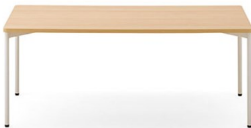
T20 M2-1800W900D-LD-WH ¥100,400 720H 脚部:¥29,300 天板:¥53,900 > P313 表面材:メラミン化粧板 継材:ABS樹脂 ○反り止めパーツ付