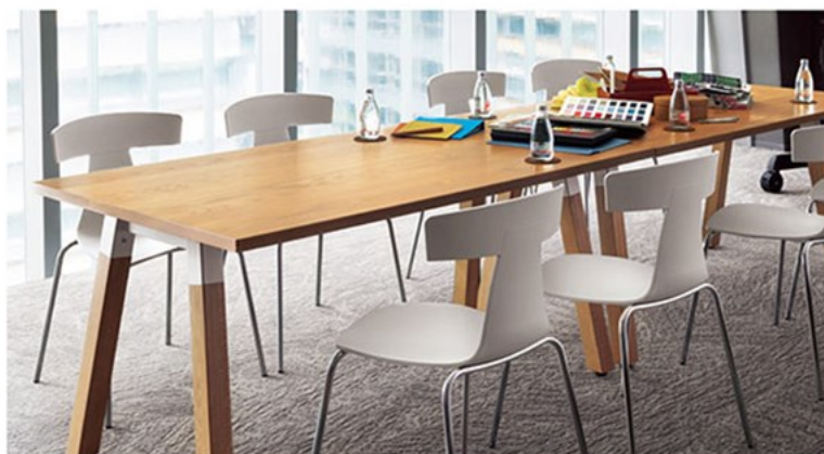
▲TB3006-LN-WH/NA-OA ¥149,000 1500W900D701H ○反り止めパーツ付 チェア:ラメCRA(P184)