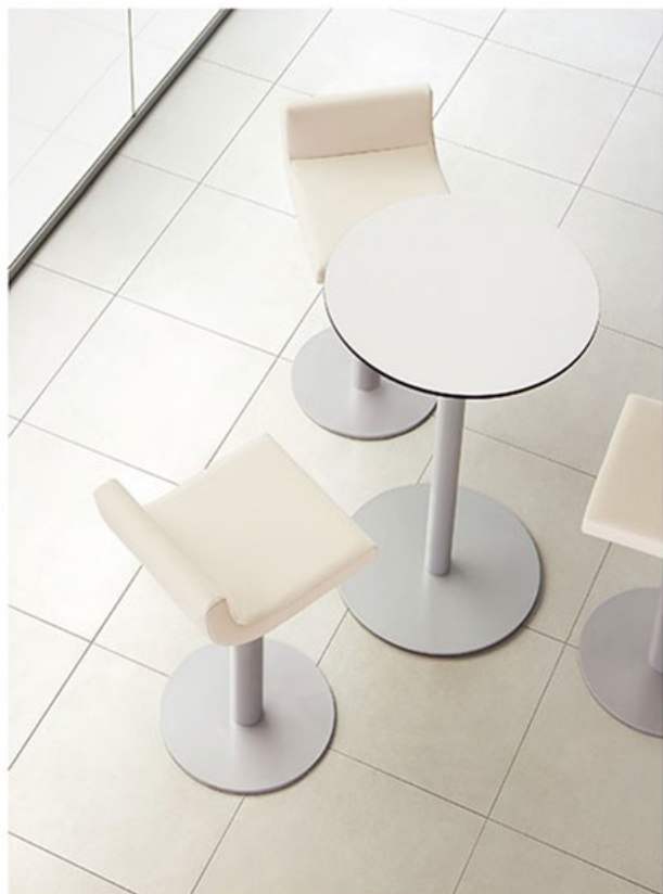
▲アディ SVC-SI ¥53,900 素材:レザー・C22 (No.1) 脚:スチール円盤脚 (粉体塗装・シルバー) 400φ テーブル:T113 MW・600φ・CSS-SI (P319)