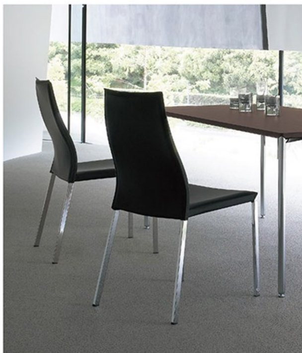
▲コリーダ A ¥37,500 テーブル: TB2443-M5 (P347)