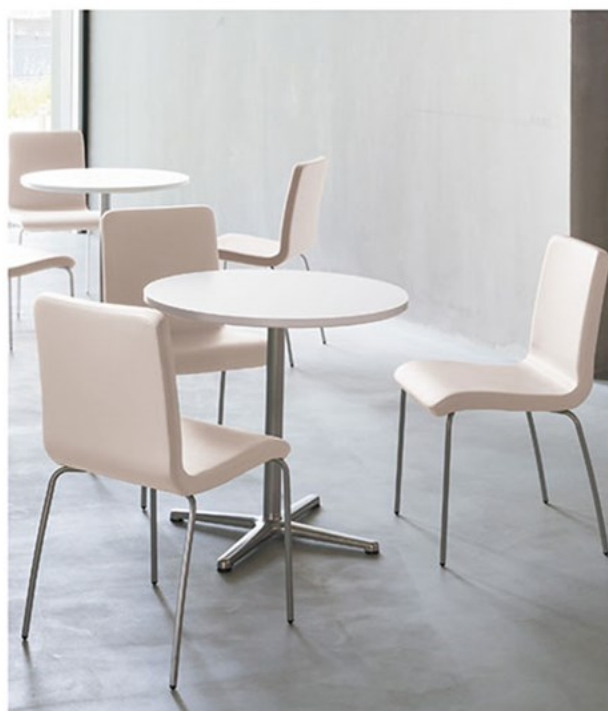
▲ベッソ ¥47,600 素材: レザー・B-15 (No.50) テーブル: T14 MW-750φ・GF-PO (P318)