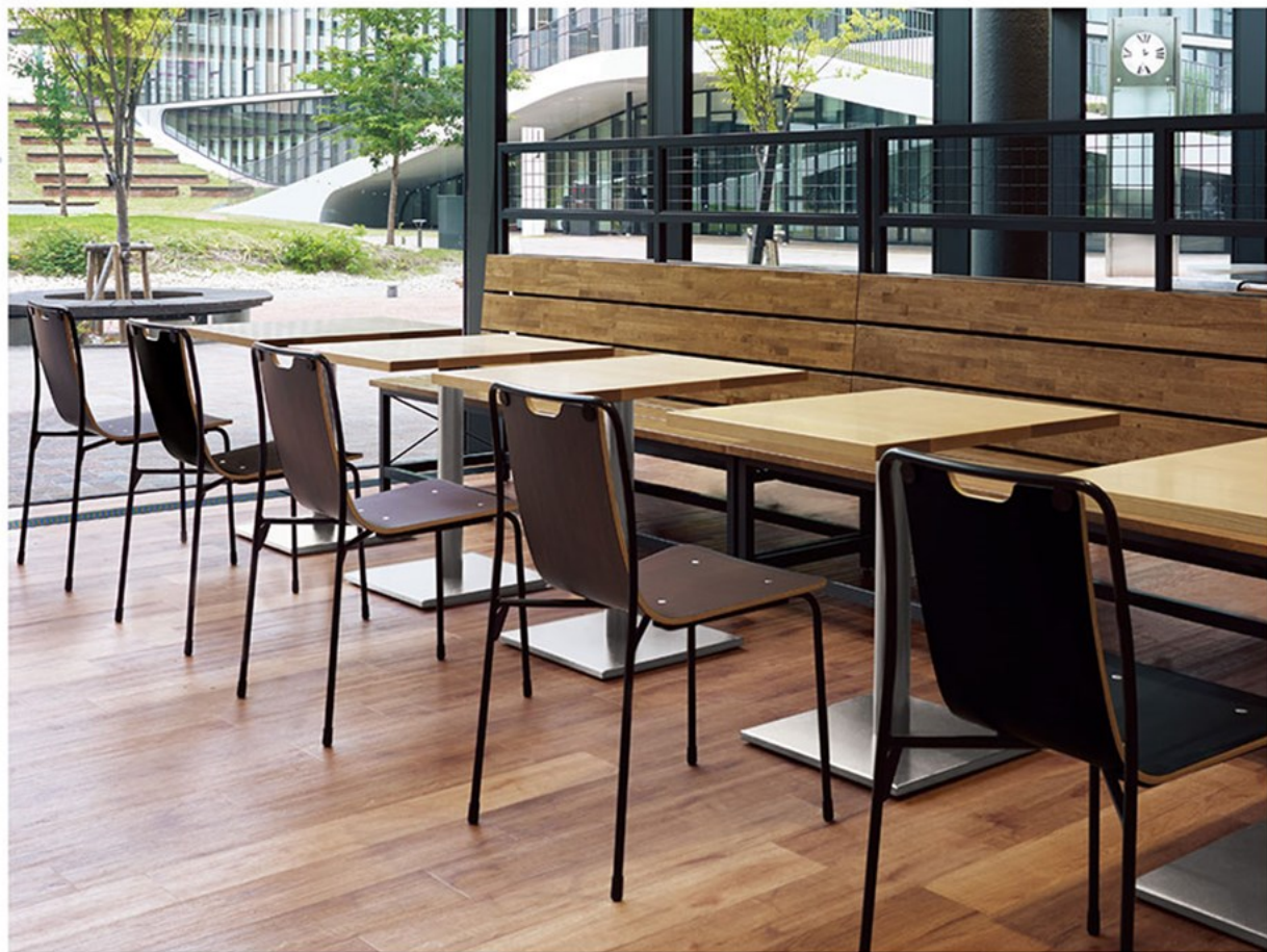
▲アニタ1 BL-MD アニタ1 BL-MB ¥38,400 テーブル:TBS3049-EV-SI (P325)