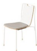
2 WH+MV レザー-A-80 (約91)

座 フレーム 本体 1 2 カラー 塗装 SI WH BL MN MD MB MW