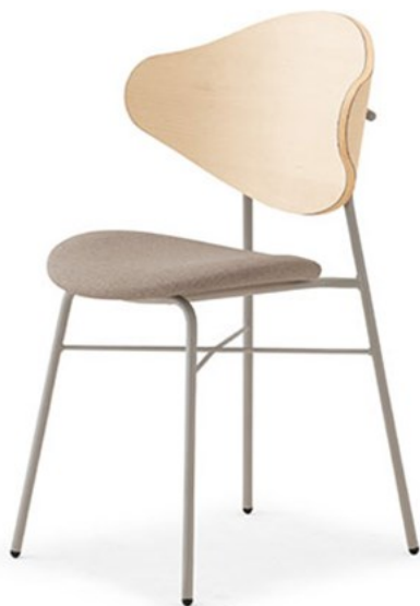
ナプアW2 SI-ML ¥40,600 素材: レザー-C38(No.5)

◀ナプアM1GL-MX ¥37,200 テーブル:TB2923-VJ-DB(P341)