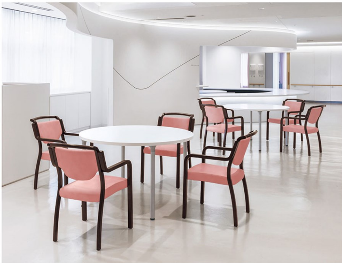
▲ロワ 1N ¥57,300 素材:レザー・C-38 (No.3) テーブル:T18MW-1200φ-MD-SI (P315)