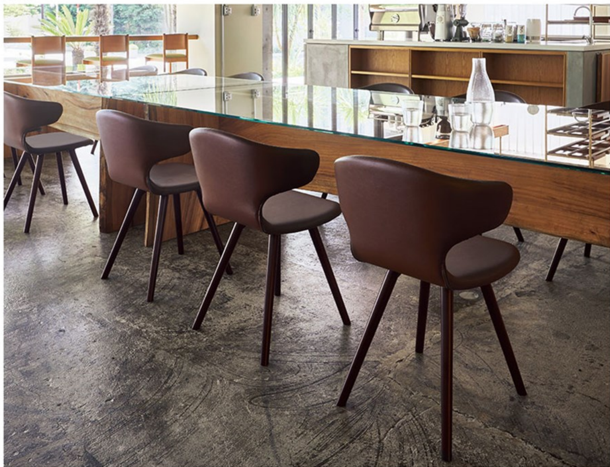
▲バンセW 1N ¥64,400 張材:レザー-B-15 (No.43) 奥のカウンターチェア:エトールカウンター SN (P217)